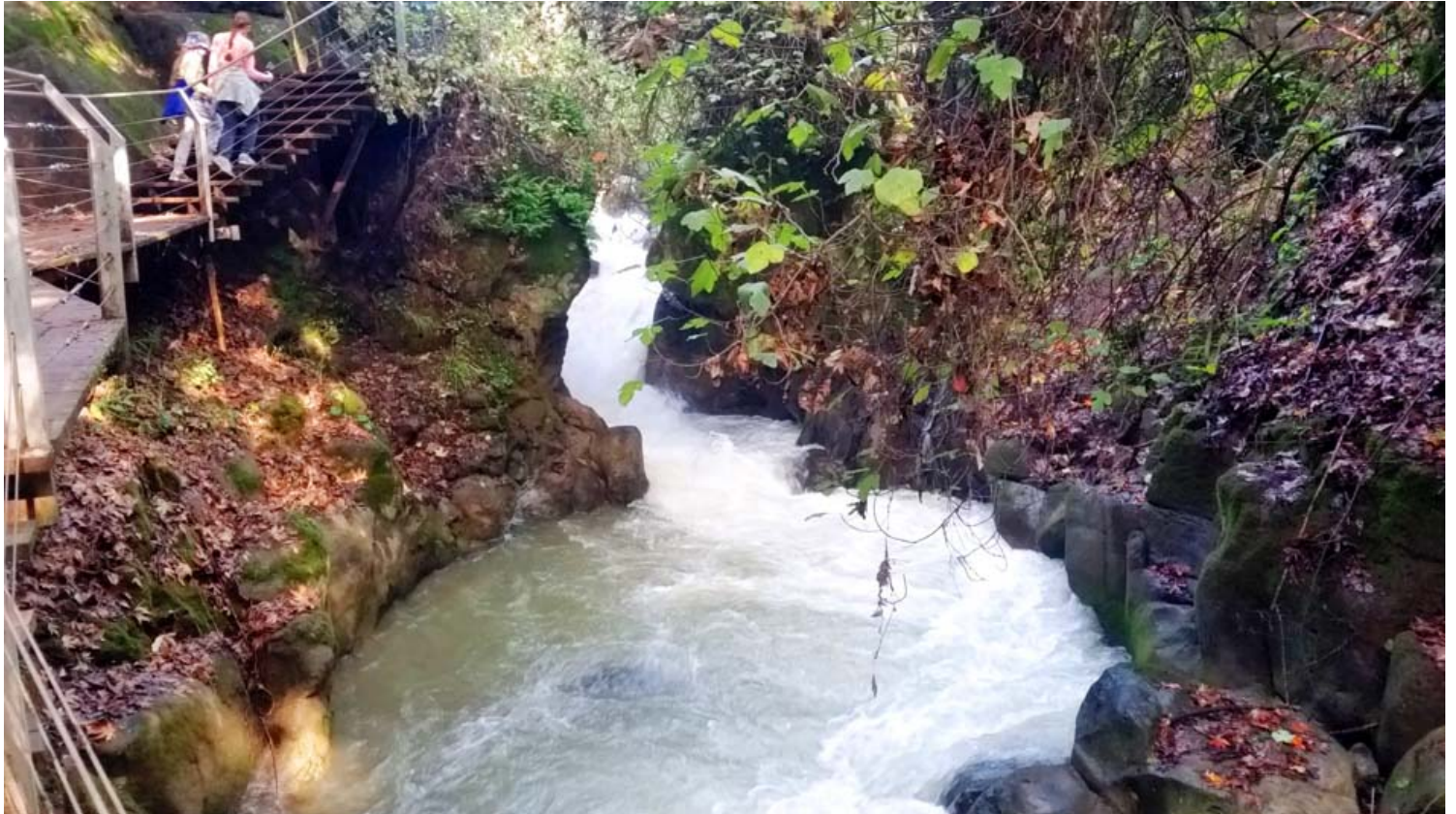
השביל התלוי מעל נחל החרמון השוצף במפלי מפלוניים.