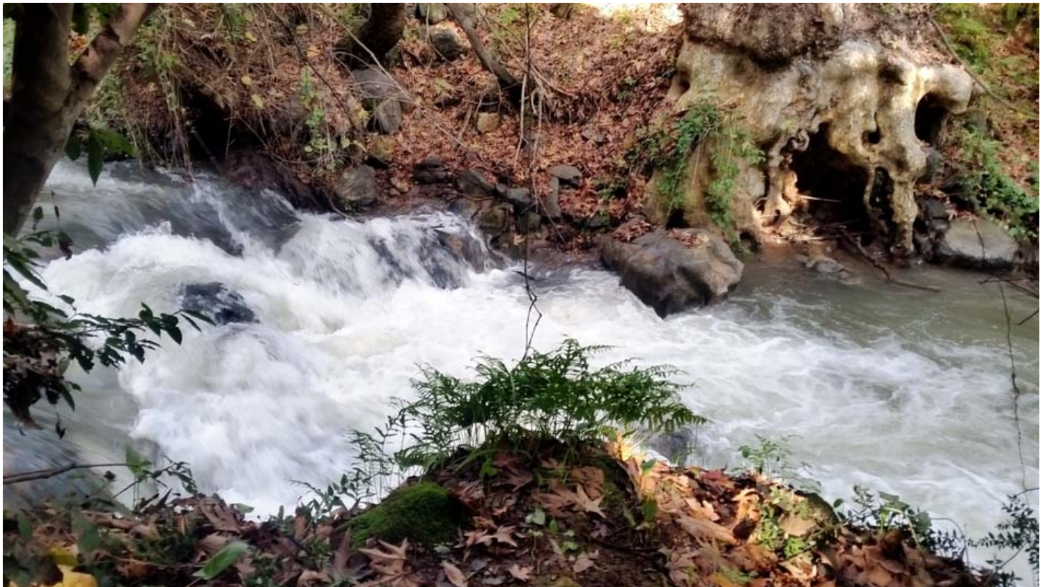
צמחייה עשירה על גדות הנחל המתפתל.