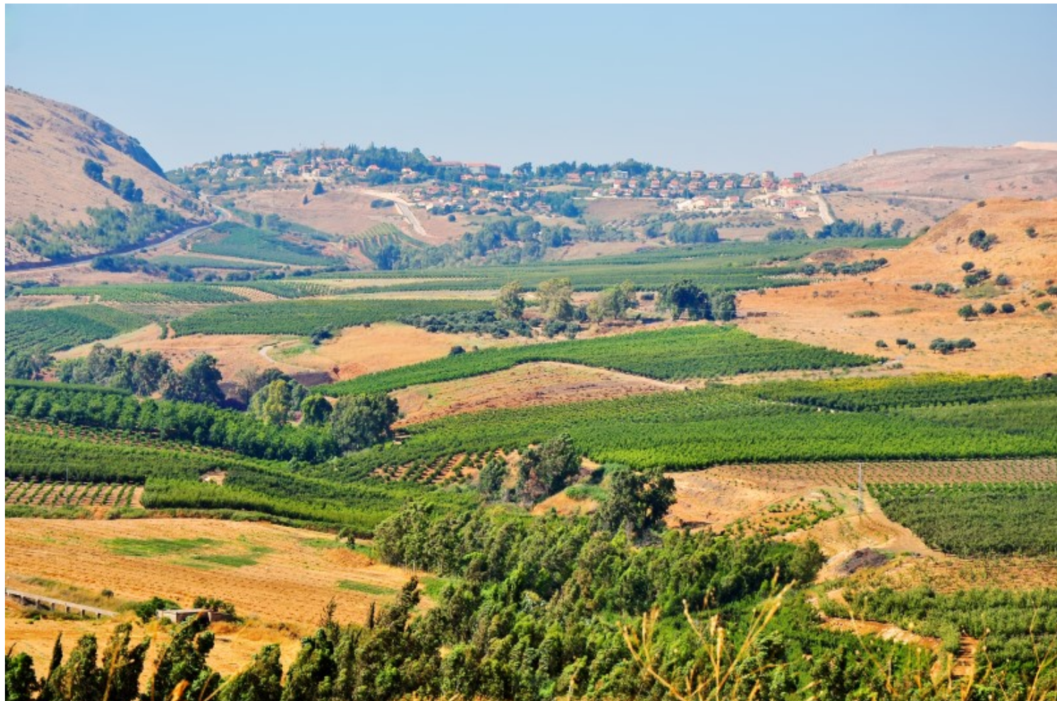
רוצים נוף ירוק מתמיד? סעו לצפון.

בעבר היה כאם יער של אלוני תבור, כיום נותרו רק שרידים. אחרי מבנה השאיבה של המוביל הארצי, תוכלו למצוא בקתה קטנה ובה המוקד של קק"ל, בה תוכלו לקבל הסבר קצר על המקום, ולקבל מפות המציגות את המסלול.