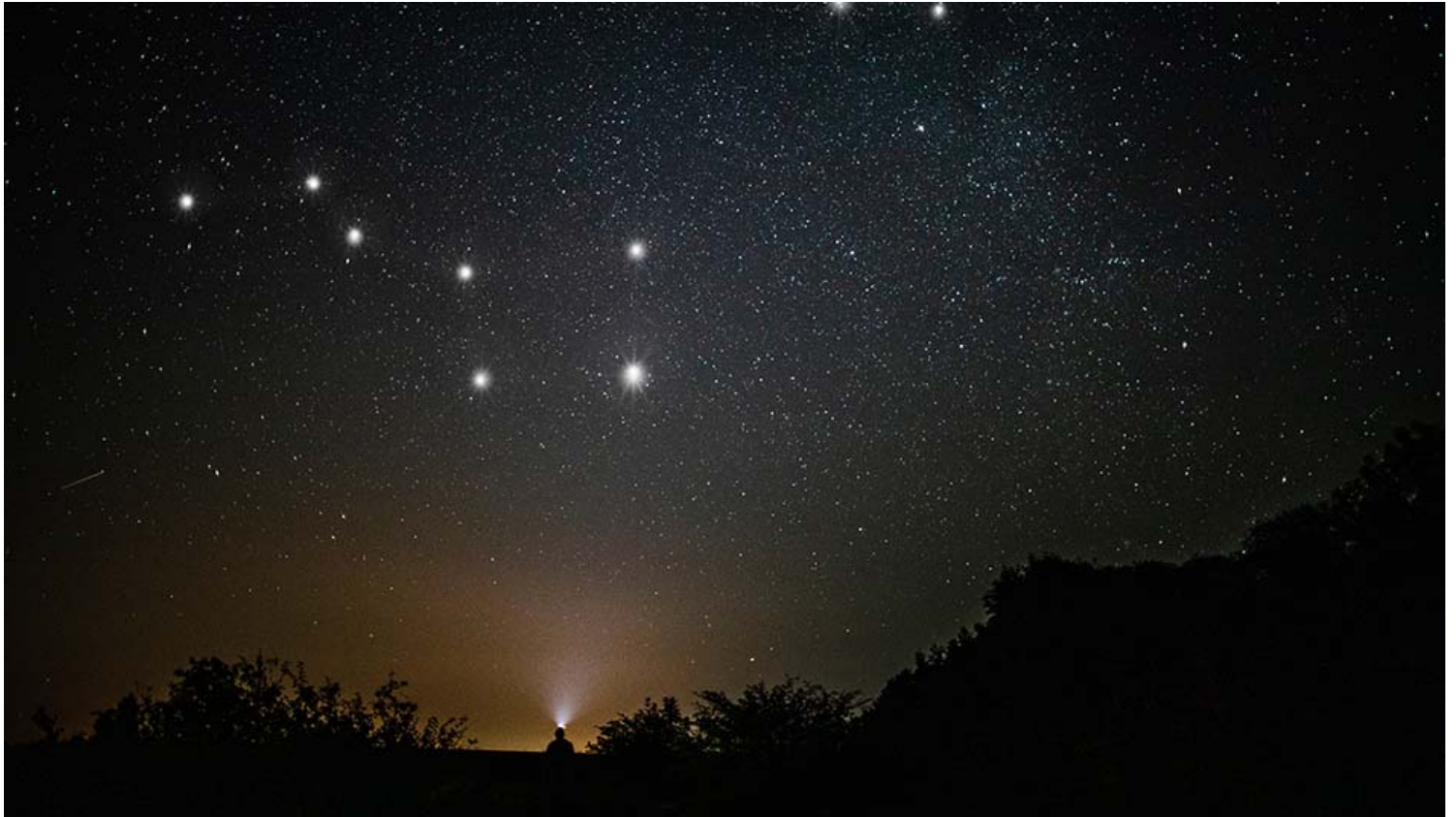
שמיים זרועי כוכבים . המוקדים בהם יתקיימו תצפיות

תשע תצפיות כוכבים שונות יתקיימו בין השעות 19:30-22:30 בתאריכים: 13.7, כ"ד תמוז - יום חמישי, 17.7, כ"ח תמוז - יום שני, 7.8, כ' אב - יום שני, 10.8, כ"ג אב - יום חמישי וב-27.8, י' אלול - יום ראשון. לכל התצפיות יש להגיע עצמאית.