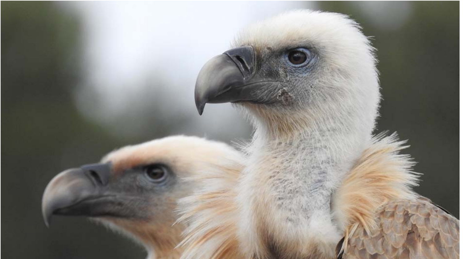
נשר בחי בר כרמל. חודש הנשרים בשמורת הטבע חי בר כרמל:

הסיוור ללא תשלום נוסף על דמי הכניסה לאתר, חינם למנויים, יש להזמין מקום מראש באתר רשות הטבע והגנים, *3639