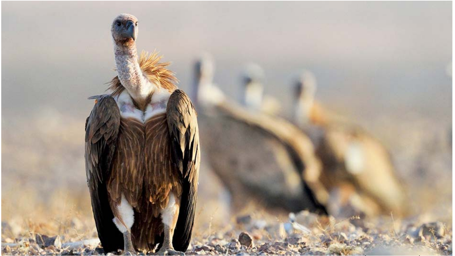
הנשר מלך העופות.

ישנן סיבות נוספות הפוגעות בנשרים, כמו התחממות מלוחות והתנגשות בקווי מתח, שינוי בשיטות רעייה ושינוי בפיזור המזון במרחב ואיכותו, בצד הפרעות במצוקי הקינון. כל אלו מעצימים את הירידה הקיצונית במספר הנשרים, וכיום הם בסכנת הכחדה חמורה כמקננים בישראל, והם מתקיימים רק בזכות מאמצי שימור נרחבים של רשות הטבע והגנים, במסגרת פרויקט "פורשים כנף" ושותפים רבים נוספים.