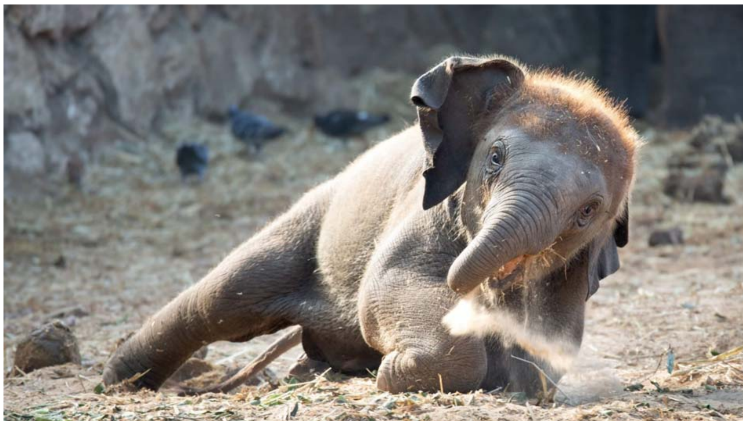
פילון תינוק עם אמא לה-פטיט בספארי ר"ג.

לאחר שהחצר הייתה נקייה ומהבריכה נשאבו המים והוזרמו מים חדשים, הובאו לספארי גם 7 משאיות גדולות מלאות בחול ים רך שהפילים אוהבים במיוחד והוא פוזר בבתי הלילה ובחצר. בשלב הראשון האם והפילון היו בבית הלילה הנפרד, אחרי מספר ימים האם חוברה לבנותיה ולנכדתה, ולאחר 11 יום חוברה גם ורדה, הנקבה החזקה בקבוצה ולאחר מכן גם מותק הזכר. החיבור עבר בהצלחה והמטפלים מרוצים. בספארי מחפשים לפילון שם שמתחיל באות פ' כשמה השני של אימו (בחצר כבר יש הרבה פילונים ששם מתחיל באות ל' כאות הראשונה של שמה). עכשיו רק נותר לנו לחכות שהתקופה הזו תחלוף וצחוקם של הילדים יחזור להישמע בין שבילי הספארי.