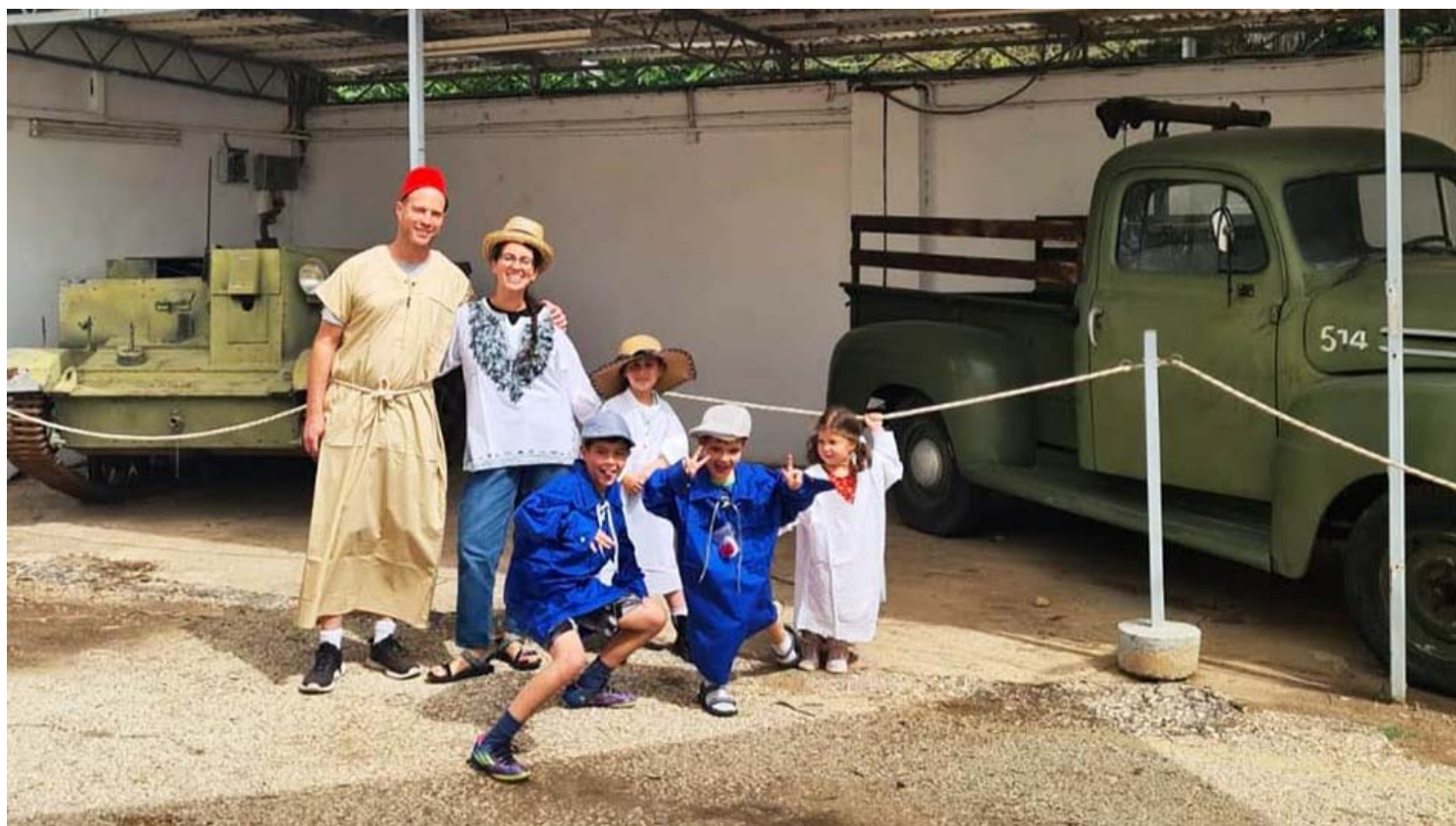
עצמאות באתרי המורשת.

מחיר למשתתף מגיל 3 ומעלה: 10 שקלים. מתנה לכל ילד: משחק מלאכת שימור. בהרשמה מראש בלבד!