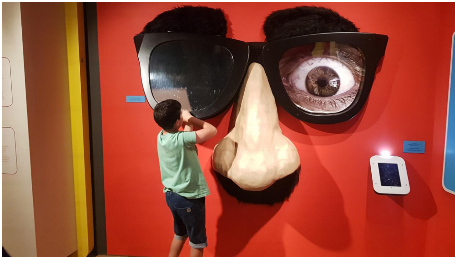
הומור יהודי סביב העולם.