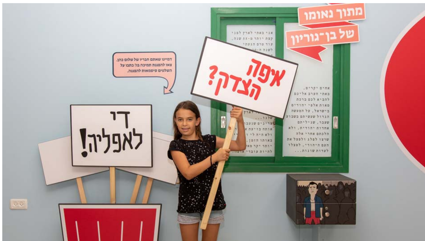
הזקן והעם, תערוכה בשדה בוקר.

בעזרת סרטוני וידאו תיעודיים לצד אנימציות משעשעות, תחפושות, שלטים ולוחות מחיקים, יוכלו המבקרים להביע את דעתם בכל אחד מהנושאים, ואף לשאת את דבריהם מעל דוכן נואמים שמוצב במקום. דור האינסטגרם יוכל להמליץ למנהיג כיצד לדבר עם בני נוער, הורים יספרו לילדיהם את השתלשלות שם המשפחה וביחד אף יוכלו להביע את דעתם ולחשוב איך היו רוצים לראות את המציאות והחברה. התערוכה מאפשרת חוויה משותפת ייחודית בין הורים לילדים, עם המון צבע ועניין והזדמנות להכיר תקופה אחרת בשפה עכשווית.