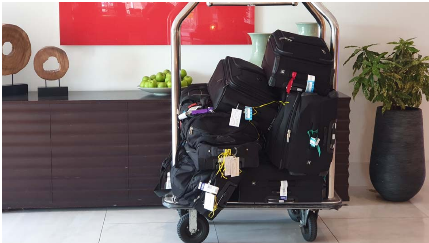
מלונות בחו"ל - כמה אנחנו משלמים.

העלות הגבוהה יחסית של המלונות בישראל זוכה לאישור נוסף גם בסיכום השוואתי של מחירי הלינה. העיר היקרה ביותר בלינת ישראלים היא הרצליה שבה שולמו 262 דולר ללילה בממוצע ואחריה מלונות עין בוקק בדרום ים המלח (239 דולר), אילת (222 דולר), נתניה (200 דולר), תל אביב (196 דולר), ירושלים (170 דולר) וטבריה (167 דולר).