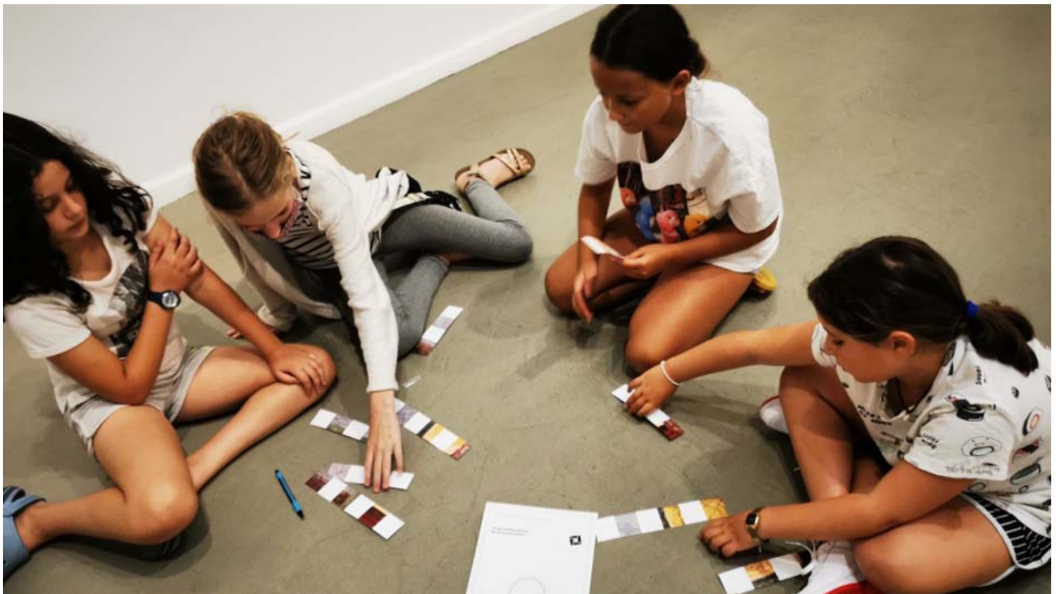
אומרים אהבה יש בעולם במוזיאון. צילום אגף החינוך של מוזיאון תל אביב לאמנות