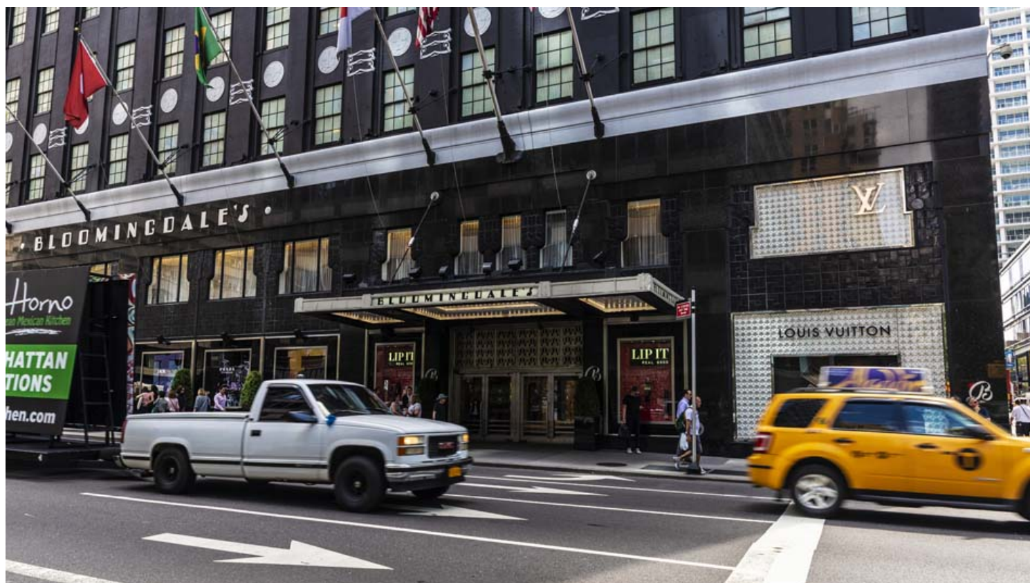
בלומינגדיילס: מקום בו צולמו סצנות רבות בסדרה חברים.