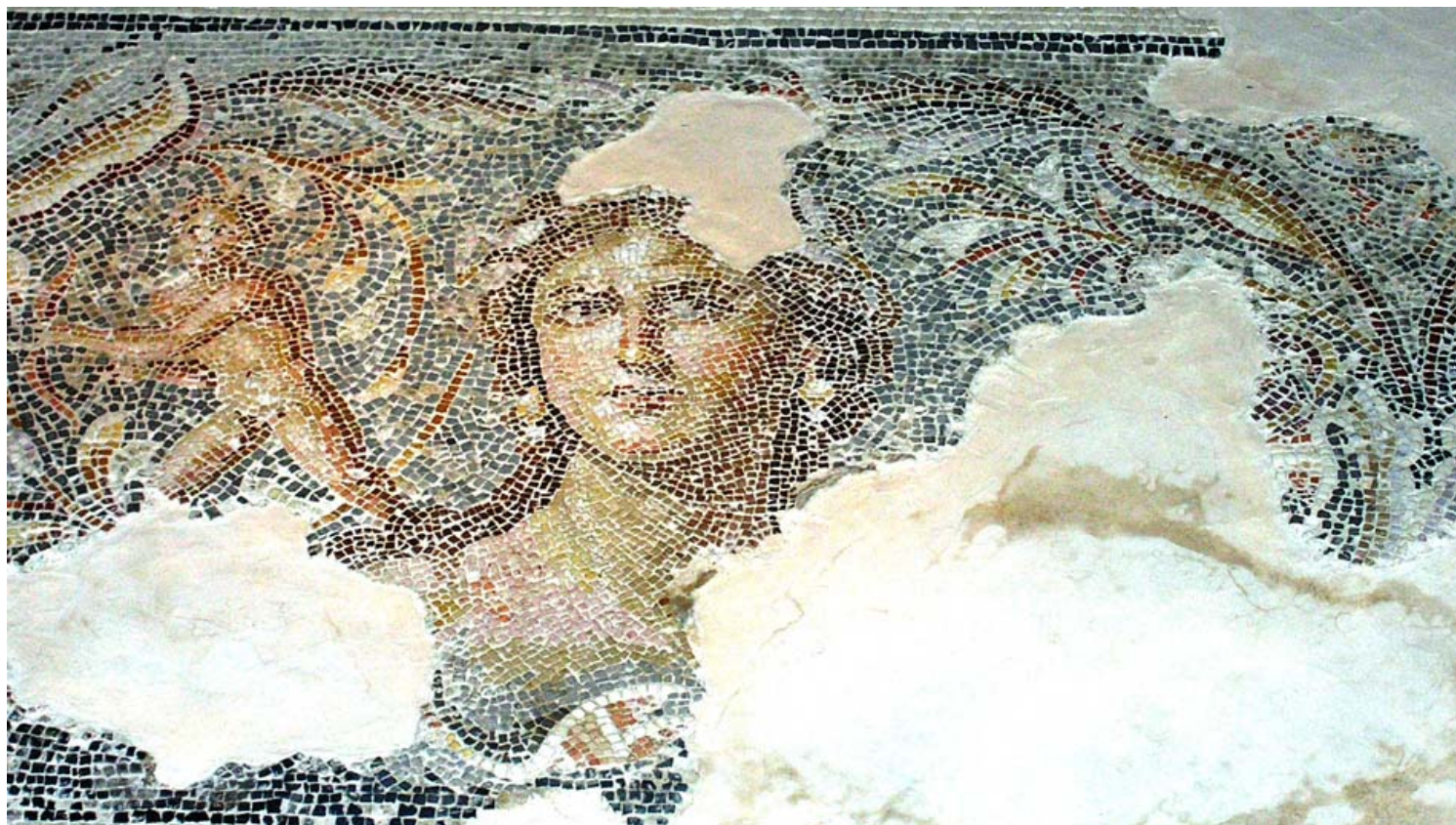
הפסיפס המפורסם בגן לאומי ציפורי.