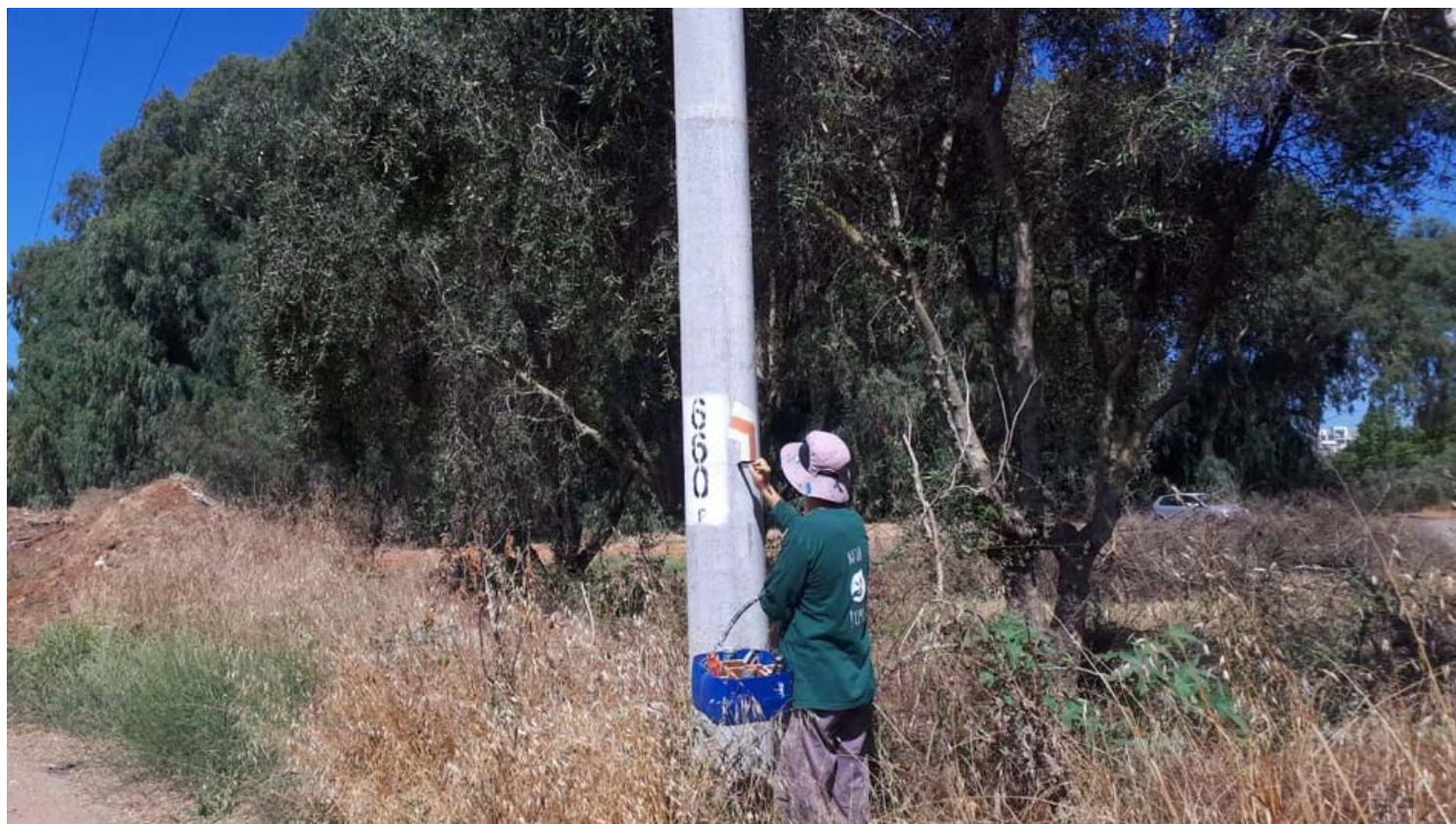
מסמנים את שביל השרון המחודש המציע שפע אטרקציות.

הצלחנו להציג בפני הישראלים את אזור השרון, שבדרך כלל המטיילים פוסחים עליו וממעטים לטייל בו", אומר איציק בן דב, רכז סימון שבילים בחברה להגנת הטבע.