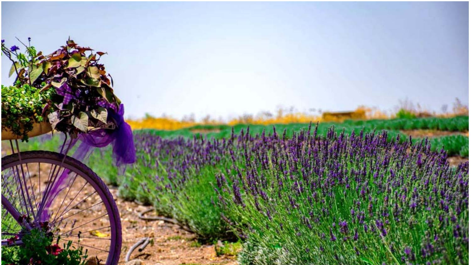
זה הזמן לטייל בניחוח פרובאנס במושב כנף. מסלול טיול:

דיר עזיז (מעייין כנף) - במתחם שלוש בריכות האוגרות את מי המעיין, הנובע במקום וניתן לתצפת משם על נוף המרהיב של נחל כנף. במסגרת הנגשת אתרי תיירות, מועצה אזורית גולן ביצעה עבודות תשתית, בהן שופץ המעיין והונגש לבעלי מוגבלויות. בית הכנסת העתיק באתר עבר גם הוא סדרת חפירות ושיקום.