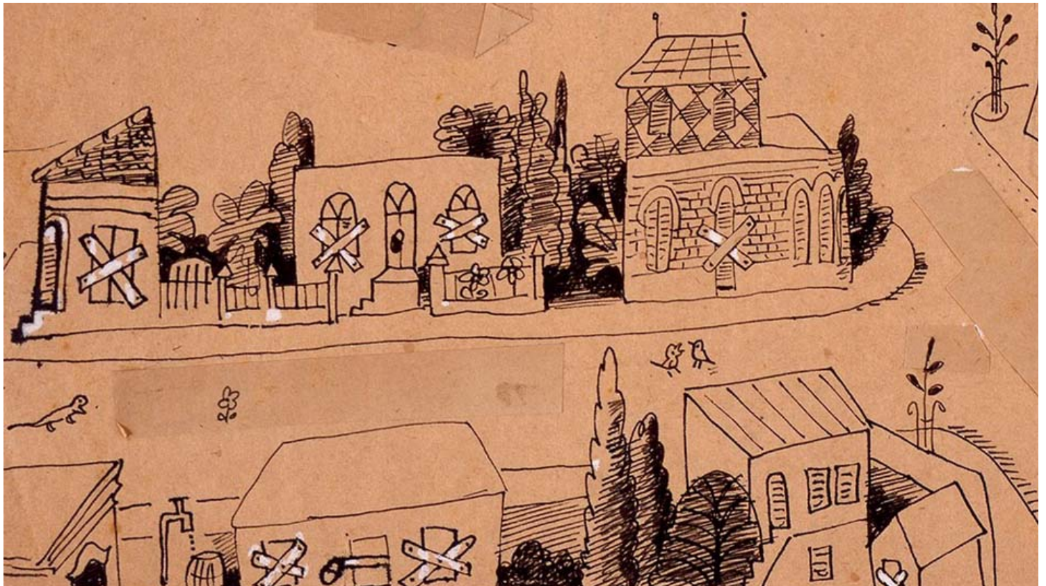
ת"א בתקופת הגירוש. איור נחום גוטמן, באדיבות מוזיאון נחום גוטמן לאמנות

בהשראת הרוח האופטימית והחיונית של נחום גוטמן, מוזיאון נחום גוטמן לאמנות שמח להשיק מגוון תכנים ופעילויות וירטואליות, שיסייעו לילדים ולכל המשפחה להעביר בנעימים את ימי הקורונה. בימים ובשבועות הקרובים יעלו לאתר האינטרנט ולרשתות החברתיות של המוזיאון, תכנים מיוחדים והצעות לפעילויות בבית עם הילדים, ביניהם: סיורים וירטואליים במוזיאון, סדנאות יצירה בעזרת חומרים ביתיים, משחקים ועוד.