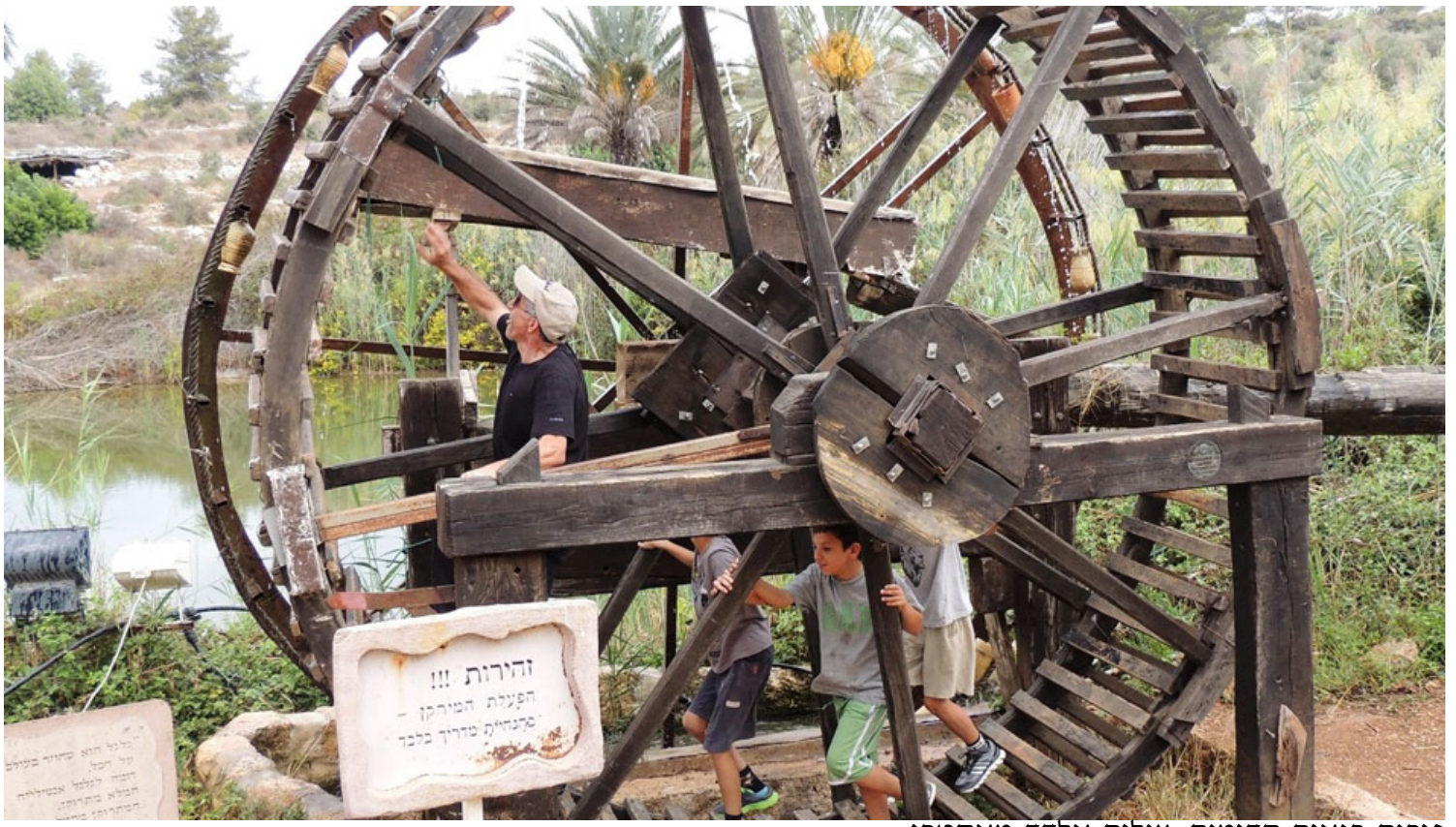
פורים בנאות קדומים.