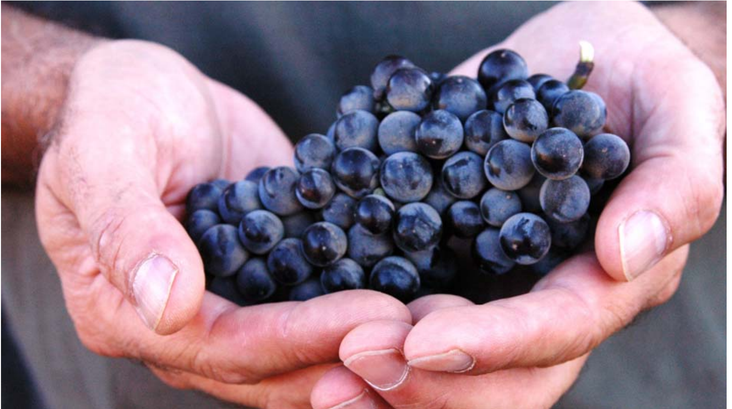
חוגגים עצמאות ביקב בזלת הגולן.