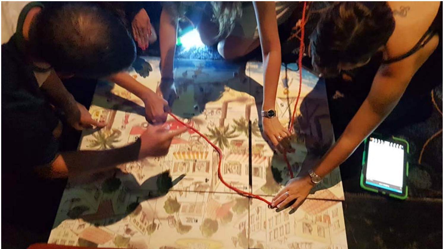
משחק הרפתקה של רונדו go.