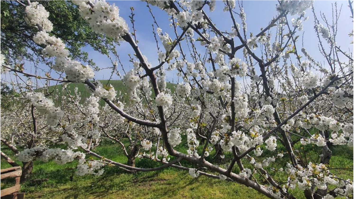
פריחת הדובדבן בחוות הסוס והדובדבן.

https://www.time2escape.co.il/escape-cinema