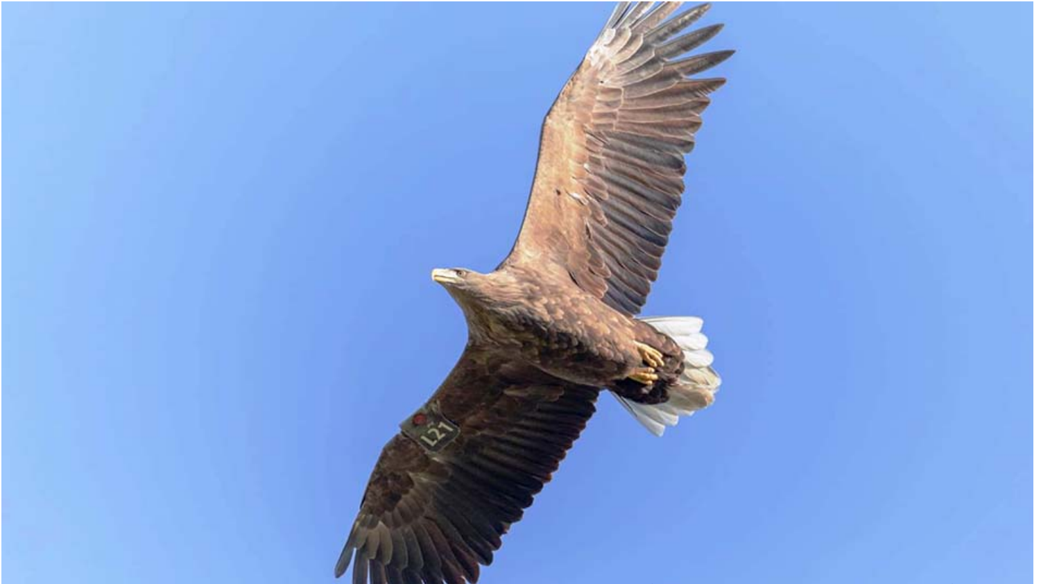
תיעוד של העיטמה (שמתה) משנת 2019.

ההרעלה שהיה ליד מאגר דלתון והיום כ-50% מהאוכלוסייה. בטבע נותר זכר אחד (אולי זכר נוסף מסתובב מחוץ לשמורה אבל זה לא ודאי). ניתן לומר שהמין נשחית מישראל פעמיים. למרות החשש הראשוני נמצא בבדיקה במכון הווטרינרי כי אינה חולה בשפעת עופות למרות ההתפרצות בעמק החולה ובשבאירופה נמצאו עיטמים לבני זנב שנפגעו בחדשים האחרונים בשפעת זו".