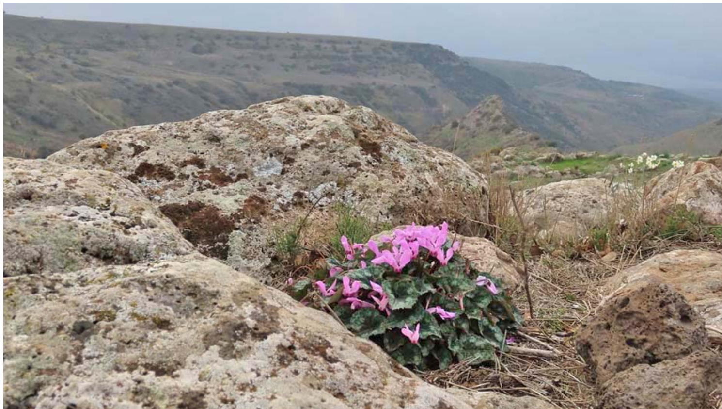
פריחת רקפות בנחל עיון.

ללא תשלום נוסף על דמי הכניסה, חינם למנויי מטמון.